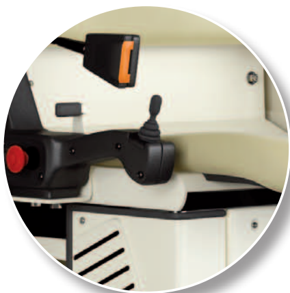
Mando integrado; fácil y cómodo

Elba está dotado de todos los dispositivos necesarios para garantizar su seguridad durante los desplazamientos; equipado con dispositivos antichoque, antiplastamiento y paracaídas homologados TUV: Elba le permitirá desplazarse con total tranquilidad. Además, gracias a su ingeniería, con Elba podrá moverse con total libertad y con el máximo confort; el arranque gradual y la reducción de la velocidad en proximidad de las curvas son sólo dos de las numerosas soluciones adoptadas para garantizar su total comodidad.