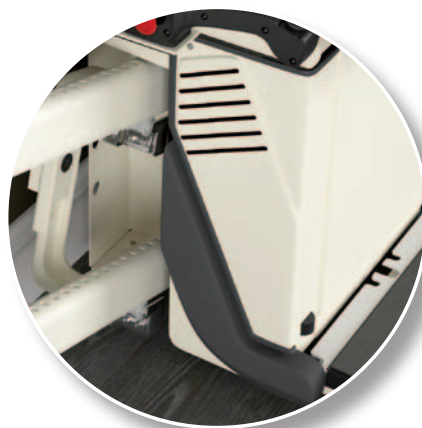
Dispositivos antichoque y antiplastamiento