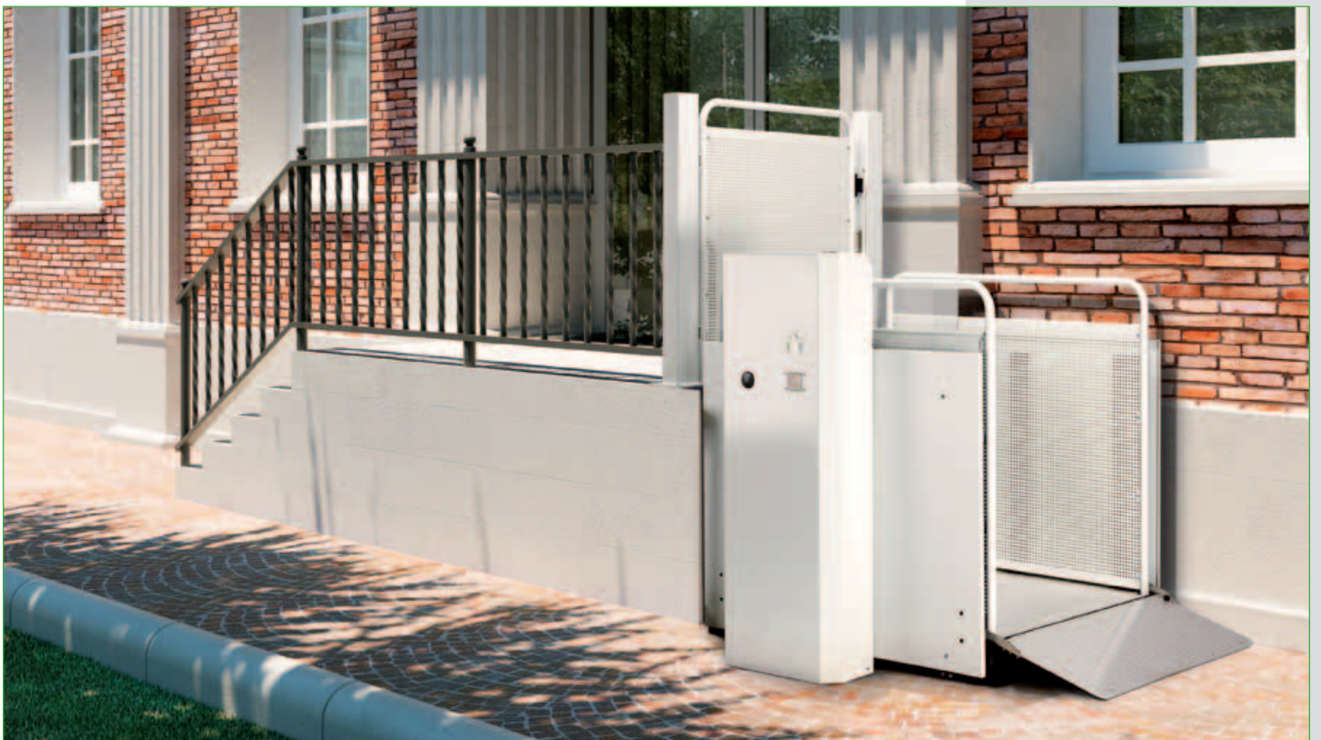
Versión estándar de acero pintado RAL 9018 (blanco papiro)