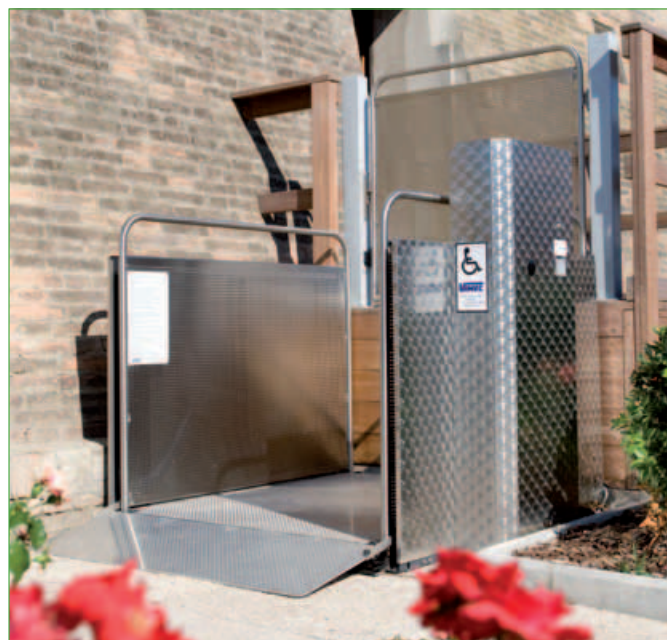
Versión de acero inoxidable (opcional)