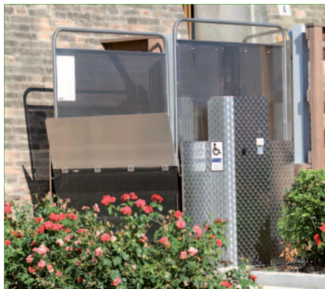
Versión de acero inoxidable (opcional)