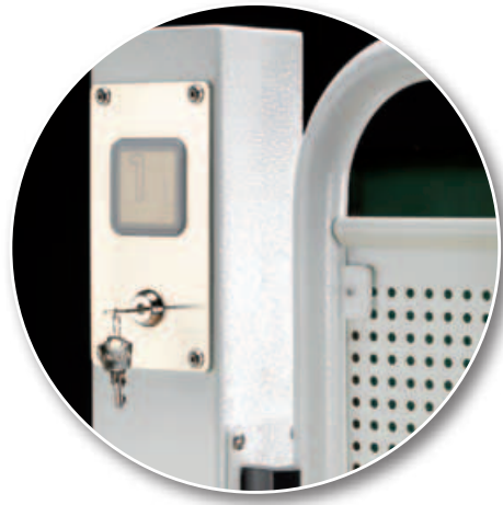
Botonera de piso